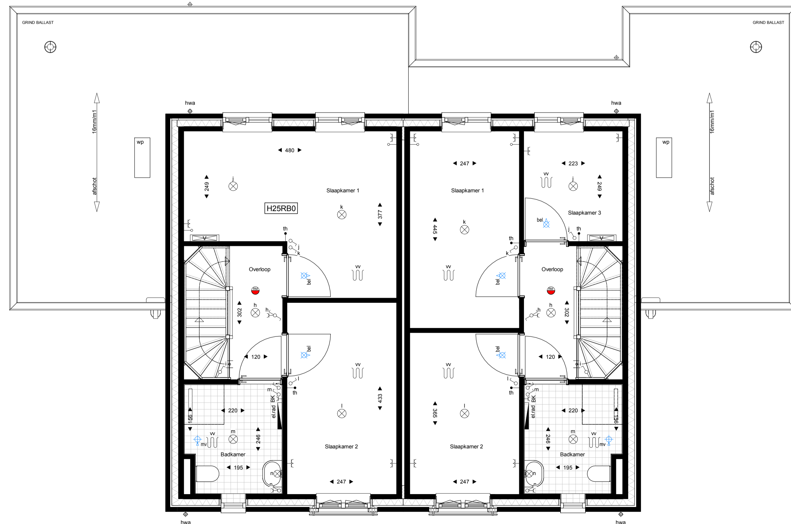
Eerste verdieping 1 : 50