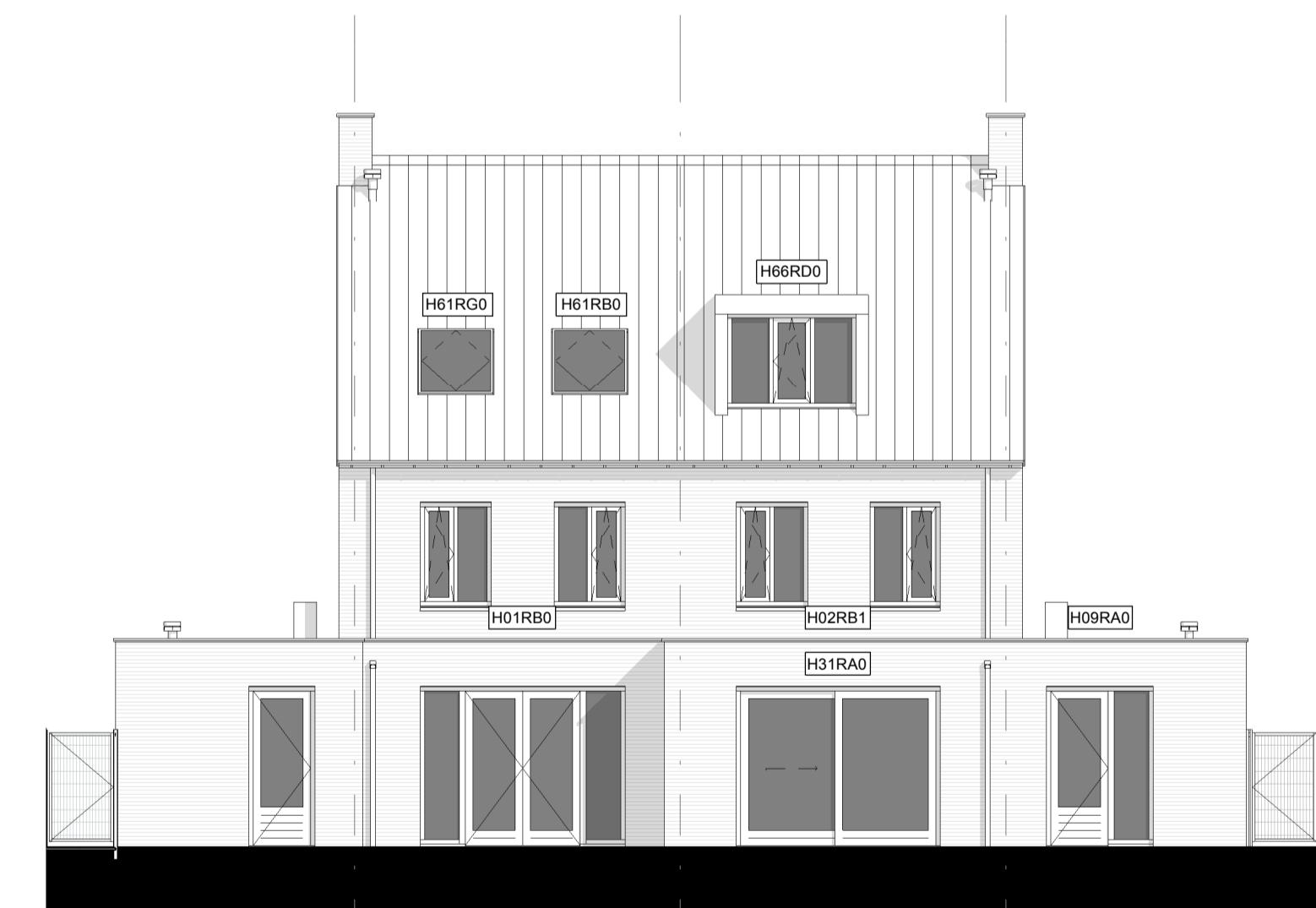
Achtergevel 1 : 100